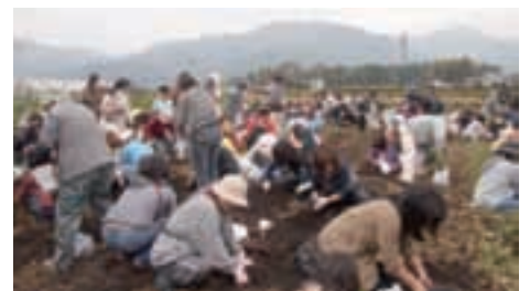
市民菜園での収穫祭

市では遊休化している農地などを対象に市民菜園開設を支援し、健康づくりや、生きがいを図りながら、農地の有効利用を進めています(6月現在、市の市民菜園は15カ所、民営の市民菜園は11カ所になりました)。一部の菜園では収穫祭なども行われています。