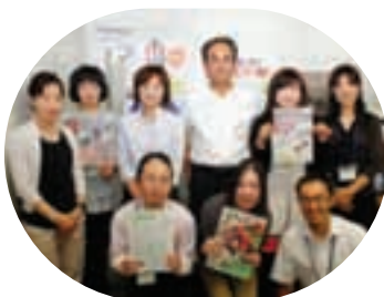
私たちが作っています！

より親しまれ読まれる広報紙を目指し、4月上旬号からリニューアルして4カ月目に入りました。そこで、リニューアルした広報よっかいちに対する市民の皆さんのご意見をお聞かせください。広報よっかいちを市民の皆さんと一緒に魅力のあるものにしたいと考えていますのでよろしくお願ひします。