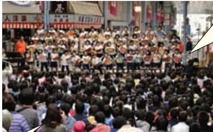
11月13日に開催された「まちかど音楽会」の様子

今年も音響設備の設置を始めた会場の設営、防犯対策などを、たくさんの地域の人や保護者にご協力いただき、子どもたちの歌声が商店街に響き渡りました。そんな中、買い物帰りの人など道行く人が立ち止まって歌声を聴いていく温かい手作りの音楽会となりました。また、最後は校歌を歌い、会場が一体となって盛り上がり、素晴らしいフィナーレになりました。