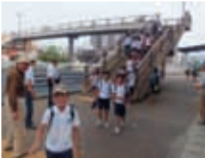
下校時のパトロールの様子

中部西小学校では、地域のさまざまな職業の人が先生として講義をするゲストティーチャーや登下校時のパトロールなどの取り組みが行われ、地域が学校・保護者と連携を図り、子どもたちの健やかな成長を支えています。