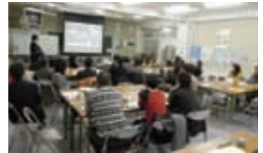
音楽会についての話し合いの様子

そして、地域の人や保護者からスタッフを募り、商店街の一角で、初めて「まちかど音楽会」を開催しました。