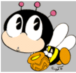
全国生涯学習マスコット「マナビイ」